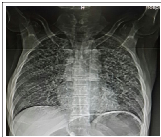
Figura 6. Radiografía de tórax con infiltrado retículo-nodulillar bilateral