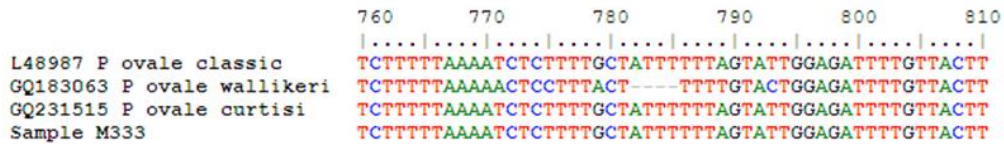
Figura 2. La secuenciación y alineamiento del fragmento de 407 pb amplificado del gen de la sub-unidad menor del ARN 18S, no presenta una delección en las posiciones 782,783, 784, una característica de la especie P. ovale curtisi .

El análisis mediante BLAST detectó que la secuencia de 407 pb presentaba un 99% de identidad con P ovale curtisi y posteriormente mediante alineamiento se confirmó que no tenía la delección en las posiciones 782, 783 y 784 que son propias de la especie P. ovale wallikeri , lo que permite diferenciar entre una especie y otra según descripción de Sutherland CJ et al. 2010 (17). Ver Figura 2.