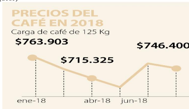
Figura 3. Precios del Café en el Año 2018 en pesos colombianos. Nota: FNC (2019).

La productividad se explica y calcula tomando en cuenta la suma producida y el tiempo empleado para lograrla; lograr una producción con un tiempo de una hora, día, año o cualquier otra división mientras que el índice de productividad para lograrla es por unidad de tierra, o rendimiento de los cultivos (Lazo, 2013).