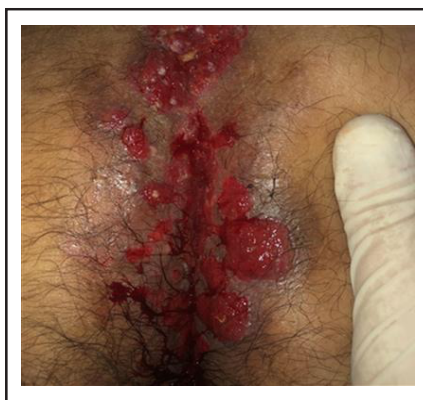
Figura 2. Herpes simple. Lesión ulcerosa múltiple en pliegue de glúteos, resistente al tratamiento.