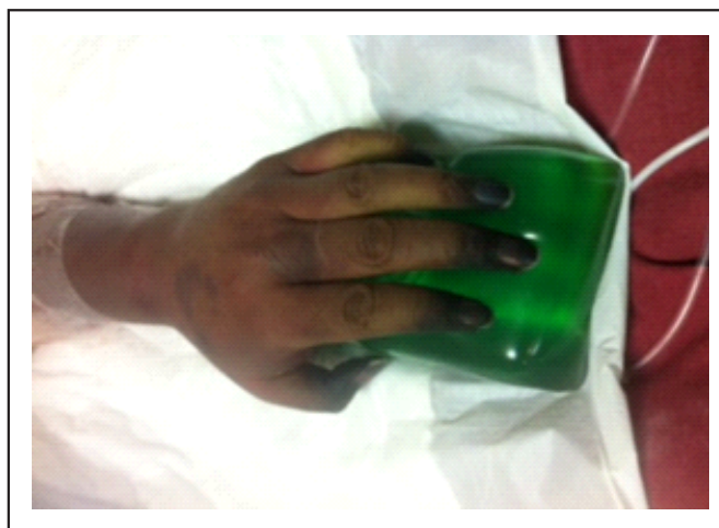
Gráfico 1. Necrosis distal miembro superior al inicio de la sepsis

36,8 °C, acrocianosis (Gráfico 1), saturación O 2 al aire ambiente 75% que con apoyo de O 2 por mascarilla incrementa hasta 85%. El control gasométrico muestra tendencia a la acidosis respiratoria y se observa inadecuada mecánica ventilatoria por lo que requirió asistencia ventilatoria.