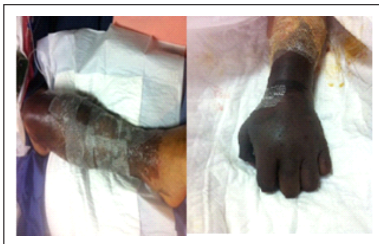
Gráfico 2. Lesiones necróticas de manos y piernas

Como parte de su evolución y dentro de las complicaciones del síndrome desarrolla púrpura cutánea en cara, brazos y piernas desde su ingreso que posteriormente se tornan de características necróticas en manos, tercio distal de antebrazo, así como en tercio medio de muslo hasta tercio inferior de piernas (gráfico 2). Por la severidad de la necrosis y ante la necesidad de plantear amputación a nivel de extremidades se realiza angiogramía de miembros superiores e inferiores que reporta vascularización arterial en el lado derecho hasta la región de la muñeca principalmente por la arteria radial hasta la región del metacarpo y en el lado izquierdo hasta el tercio medio del antebrazo. En los miembros inferiores se logra visualizar de manera adecuada la vasculatura distal por medio de las tibiales anterior y posterior de ambos lados delimitándose parcialmente los arcos plantares. Existe importante edema de los miembros inferiores y superiores, con alteración de realce en las áreas distales, compatible con defectos de perfusión.