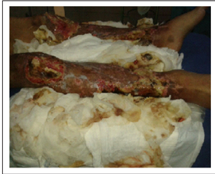
Gráfico 3. Lesiones necróticas de miembros inferiores