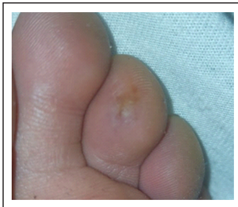
Figura 2. Se observa lesión macular eritematoviolácea en pulpejo del tercer dedo pie izquierdo.