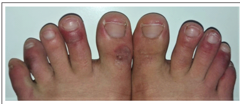
Figura 3. Lesiones eritematovioláceas en ambos pies, notándose que algunos dedos no se encuentran afectados.