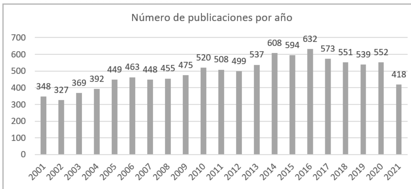
Figura 1. Progresión del número de publicaciones por año, período 2001 a 2021, en la base de datos PubMed, para la clave de búsqueda "vaccines" AND "VIH"

Con relación a la frecuencia de publicación en función de los años, en el periodo estudiado, el año con menor presencia corresponde al 2002 con 327 artículos publicados, mostrando una tendencia creciente permanente hasta el año 2016 donde se alcanza el máximo de publicaciones con 632 artículos mostrando un aumento del 93%, con respecto al 2002. El 2017 comienza un descenso de las publicaciones llegando a 539 artículos el año 2019, 552 el año 2020 y actualmente en lo que va del año 2021, 418 artículos publicados (figura 1).