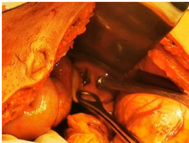
Figura 3. Vesícula biliar con coágulos en su interior.

superficial y no haber sobrepasado la fascia, razón por la cual horas después es dado de alta con signos de alarma.