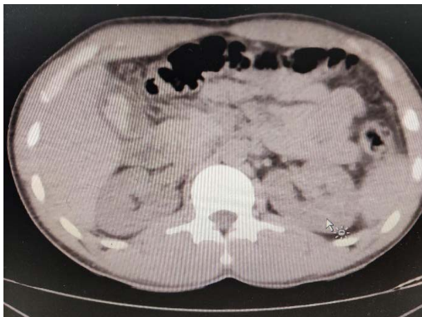
Figura 1. TAC simple de abdomen. Se observa líquido libre e imagen hiperdensa en la luz vesicular.