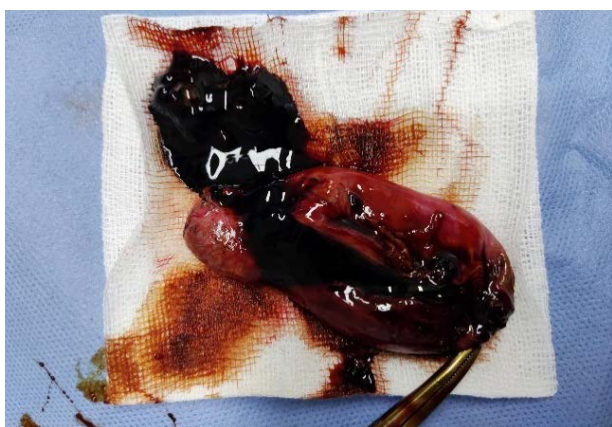
Figura 2. La laparotomía exploratoria confirma la presencia de coleperitoneo y perforación del fondo vesicular.