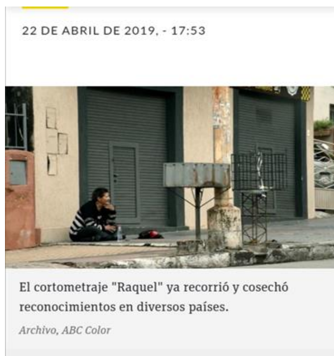
Figura 2.

Raquel encontró su propia forma solitaria, pero en red, de sobrevivencia 7 . Formó vínculos emocionales con diferentes personas de diferentes barrios; buscaba a las personas que le ayudaban para alimentarse, trasladarse de un lugar a otro (choferes de ómnibus), medicarse (algunas veces ella misma iba por su cuenta al Hospital Psiquiátrico o era llevada por patrullera), vestirse (sus hermanas) y dormir donde podía resguardarse. Se resistió a la internación y al encierro, pero aceptaba sin dificultad medicarse.