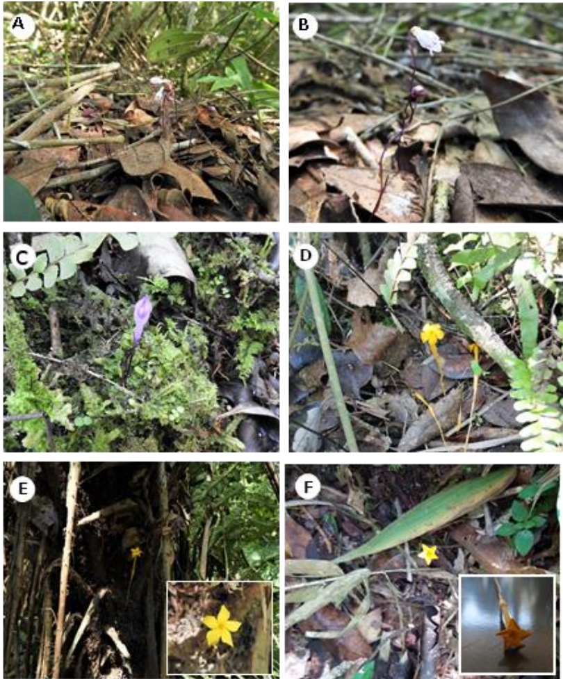
Figura 3. Individuos registrados en las áreas protegidas de ITAIPU Binacional. A) y B) A. aphylla colectado en la Reserva Natural Tati Yupi (Mendoza A. et al. 239, FCQ). C) A. aphylla colectado en la Reserva Natural Itabo (Lombardo, L. & Kubota, V. 157, FCQ). D) V. aphylla registrado en la Reserva Natural Limoy (Kubota V. et al. 132, FCQ). E) V. aphylla encontrado en la Reserva Natural Tati Yupi (Mendoza A. et al. 241, FCQ). F) V. aphylla registrado en el Refugio Biológico de Mbaracayú (sin colección).