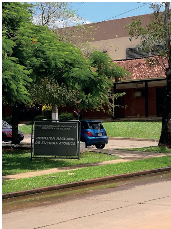
Figura 1. Sede de la Comisión Nacional de Energía Atómica de Paraguay-Campus de la UNA.

aprueba en el Paraguay la creación de la Comisión Nacional de Energía Atómica (de aquí en más CNEA), a través del Decreto Ley N° 1081/65 del Poder Ejecutivo, en fecha 30 de agosto de 1965. La CNEA se crea como un organismo bajo el Ministerio de Relaciones Exteriores, teniendo como objetivo principal el de promover y realizar estudios y aplicaciones científicas e industriales de las transmutaciones y reacciones nucleares y además de llevar adelante la fiscalización de dichas aplicaciones, es decir, tenía dos funciones principales, por un lado el de promover el usos pacífico de las radiaciones ionizantes y por el otro lado la de llevar adelante las funciones de regulación en las diferentes áreas de la aplicación de la energía nuclear y de las radiaciones ionizantes a nivel país