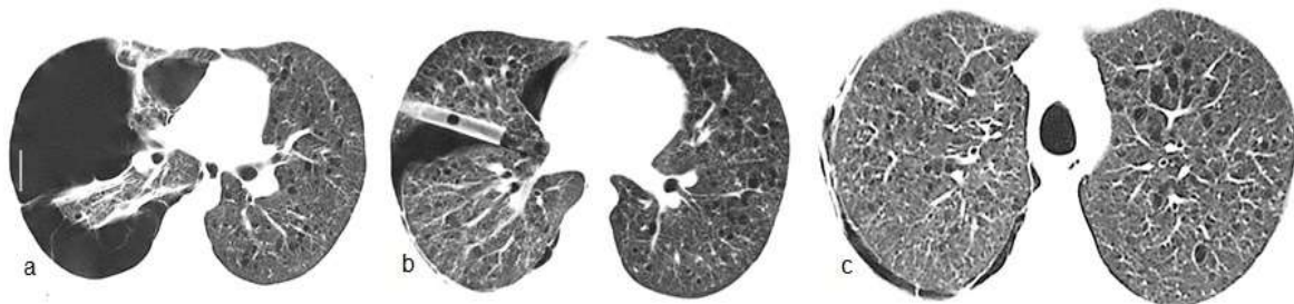
Figura 3. TACAR de tórax. (a) Neumotórax significativo a derecha y bridas a pleura que impiden el colapso total mientras que numerosos espacios quísticos se observan en campo pulmonar superior izquierdo. (b) Expansión del parénquima afectado y tubo pleural, además de notorios quistes bilaterales acompañados de nódulos. (c) Mayor profusión de nódulos en base junto a quistes en región medular con mínimo neumotórax a derecha.

Varón 21 años, funcionario público, fuma 5 cajas/año, niega consumo de sustancias ilícitas, es traído a sala de urgencias por dolor agudo en hemitórax derecho acompañado de disnea intensa. Se constata neumotórax del lado derecho (Figura 3) que evoluciona favorablemente con drenaje pleural sellado bajo agua. Antecedente de cuadro similar un año atrás. Las imágenes sugieren el diagnóstico de histiocitosis de células de Langerhans. Se inicia tratamiento anti tabáquico (bupropión, terapia sustitutiva con nicotina y abordaje conductual).