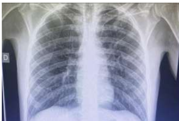
Figura 1. Radiografía de Tórax PA. No se evidencia imagen de compromiso pulmonar importante.

En la Figura 1 se puede observar la radiografía de torax en proyección postero anterior (PA) sin evidencia de imágenes de compromiso pulmonar por el hongo.