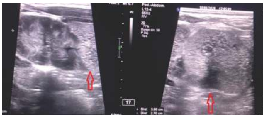
Figura 2. Ecografía abdominal: masa hiperecogénica bien delimitada, de 27 x 39 mm, en polo renal inferior izquierdo, sugerente de angiomiolipoma.

(Figura 2); la ecocardiografía neonatal confirmó hallazgos prenatales, con túberes múltiples, sin comprometer tracto de salida del ventrículo izquierdo; resonancia magnética de encéfalo (Figura 3) con nódulos sub endimarios peri ventriculares, supratentoriales, bihemisféricos, que impresionan túberes corticales, dispersos. El examen oftalmológico reportó hamartoma periférico en región nasal superior y nasal inferior, con mácula conservada.