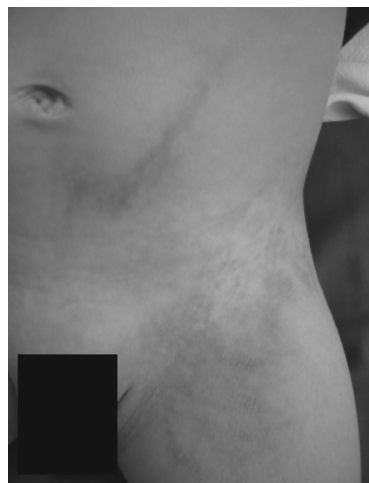
Figura 1: Se observan varias lesiones verrugosas en región inguinal izquierda.

Al examen físico presenta placas eritemato-acastañadas, bien delimitadas de bordes irregulares, superficie irregular, verrugosa con disposición lineal, unilateral en flanco, fosa iliaca y muslo izquierdo ( Figuras 1 y 2 ).