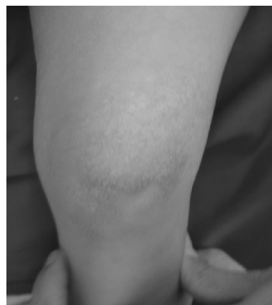
Figura 2: Lesiones en la rodilla izquierda formando una placa hiperqueratósica.

Se realiza biopsia cutánea con el fin de confirmar el diagnóstico clínico y con interés científico. Se la remite para estudio anatómico-patológico, fijada en formol al 10%, la pieza es obtenida por una biopsia cutánea efectuada por medio de un cilindro, que mide 0.3 cm. de eje mayor.