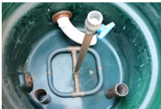
Figura 3: Sistema de aireación para mantenimiento

Este sistema consiste en la incorporación de un caño de PVC de ½ pulgada en el medio mismo del interior de cada filtro. Este caño atraviesa todas las capas naturales de filtración desde la base hasta pasar la capa del agua estancada filtrada. En la punta de arriba de este año, se incorpora una válvula de vástago para la introducción del aire con un compresor o inflador (figura 3).