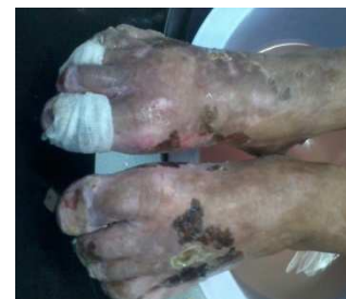
Imagen 3. DDI: 40