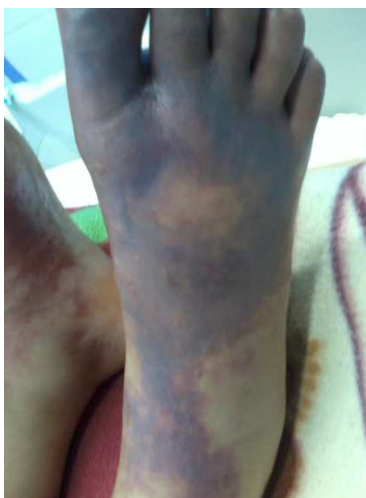
Imagen. 1: Al ingreso

desaparece, luego miembros inferiores, hasta tercio medio de las piernas. Refiere dolor quemante e intermitente. Acude a Centro Asistencial, donde se inicia AAS 625 mg/día. La remiten por empeoramiento clínico. Ingresa afebril, con ausencia de pulsos pedio y tibial posterior, además de cianosis distal de MMII (hasta tercio medio de ambas piernas). Laboratorialmente: enzimas musculares aumentadas y descenso progresivo al suspender TARV. ECG revela Onda T negativa en V1-V2-V3. Fue evaluada por Cirujano Vascular, quien plantea el diagnóstico de Trombosis arterial (Imagen 2). Se inicia Anticoagulación con HBPM. En el re-interrogatorio refiere automedicación con ergotamina – dipirona, 1 dosis, por cefalea 5 días previos al cuadro. Fue Reevaluada por Cirujano Vascular, se establece el Diagnóstico de Síndrome de no Reperusión por la ausencia de pulso y Ecodoppler que revela: A nivel de la arteria tibial anterior y la pedia, tercio distal no se constata flujo. Se planteo la amputación supracondílea bilateral, obtandose por el tratamiento conservador. Recibió Bolos de Metilprednisolona por 3 días más pentoxifilina parenteral con buena respuesta (Imagen 3)