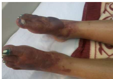
Imagen 2. DDI: 21