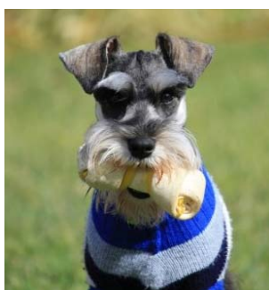
Figura 1. Fotos del cachorro Schnauzer miniatura en la actualidad.

El cachorro, macho, de raza Schnauzer Miniatura (figura 1), fue alimentado con una dieta regular basada en balanceado completo para cachorros de razas pequeñas desde el destete hasta los 10 meses. Los ingredientes del alimento balanceado incluían proteínas de ave, gluten de maíz, levaduras, huevo, aceite de pescado, fructosa y pulpa de remolacha. El aporte calórico reportado para el balanceado es de 4300 Kcal/kg y un contenido de proteínas, almidón y grasas del 33%, 25% y 20% respectivamente. El cachorro no recibió medicamentos de forma regular y su esquema de vacunación se encontraba completo para su edad.