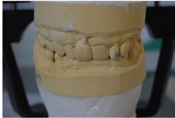
Figura 2. Montaje de los modelos para evaluación del plan de tratamiento.