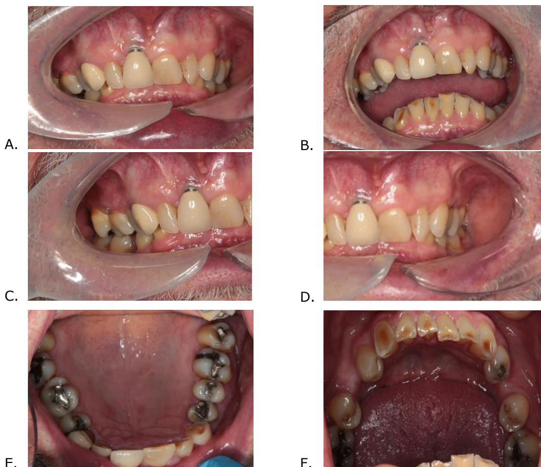
Figura 1. Fotografías intraorales preoperatorias. A. Sobremordida profunda, vista frontal. B. Pérdida moderada a severa en el sector anteroinferior. C. y D. Vistas laterales de la situación inicial. E. y F. Vistas oclusales de los desgastes en los sectores superiores (E.) e inferiores (F.).

Paciente de sexo masculino de 63 años, se presenta a la Clínica de Rehabilitación Oral de la Universidad de Odontología de Manchester, Inglaterra (Central Manchester University Hospitals NHS Foundation Trust). Como única patología de base relacionada se encuentra la presión arterial alta; la cual está controlada con Losartán 100 mg x 1 toma al día. El paciente fue referido por su debido a una moderada pérdida y desgaste del tejido dental no cariado. Su oclusión de Clase II división 2 también fue motivo de preocupación. El paciente ha recibido tratamiento previo que incluye resinas anteriores, que han fallado, y relata sentirse infeliz con la mordida que describe como "mordida apretada". El implante anterosuperior fue colocado hace 17 años, además, le dieron una 'placa' (prótesis de un solo diente) para tratar de corregir una mordida que la utilizó durante 4 semanas, pero luego discontinuó su uso.