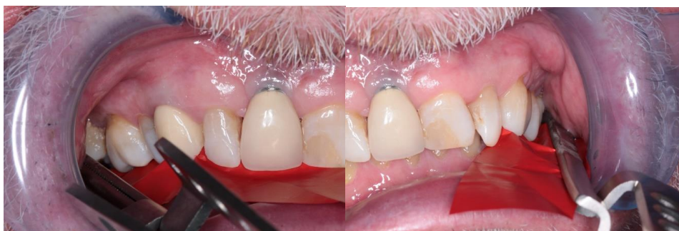
Figura 4. Control de la oclusión parcialmente restablecida.

El primer control debía realizarse en la siguiente semana de las restauraciones, sin embargo, el paciente fue de vacaciones familiares, por lo tanto, el paciente fue visto después de un mes de la aplicación de las restauraciones, para esta fecha parte de la oclusión posterior ya estaba parcialmente restablecida. Los contactos dentales posteriores se evaluaron mediante el uso de lámina oclusal Shim stock y papel de articular. Después de un mes, los contactos posteriores fueron restablecidos pero el Shim stock aún no quedaba atrapado entre ambas arcadas (6) .