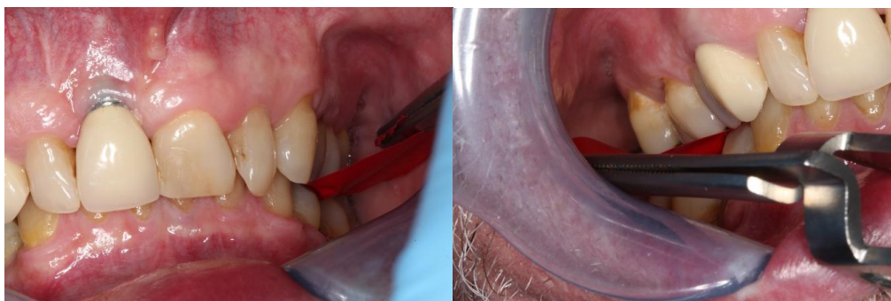
Figura 5. Restablecimiento oclusal posterior de ambos sectores.

En la cita de control luego de 3 meses de la técnica de Dahl, el control oclusal con papel de articular y la lámina Shim stock mostró un restablecimiento total del contacto oclusal posterior.