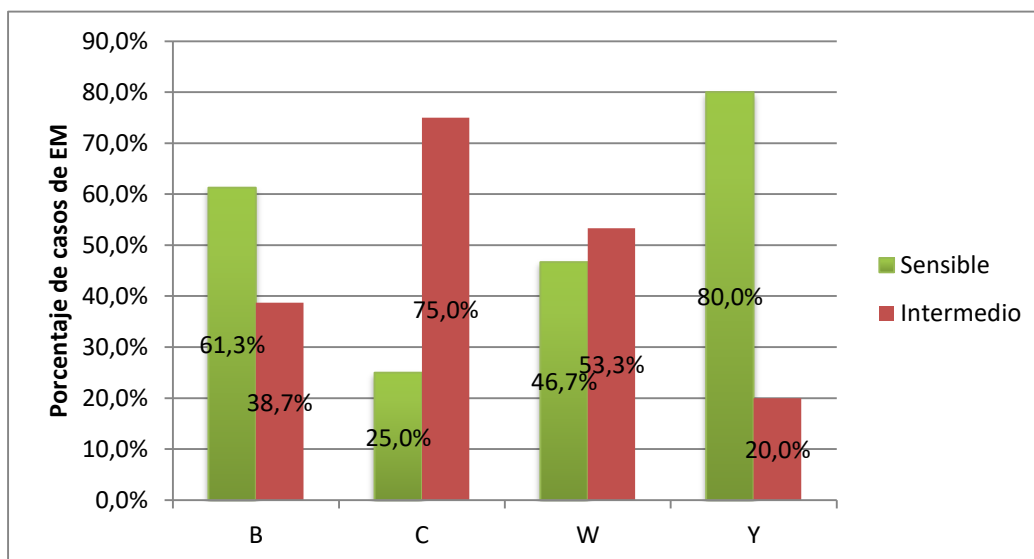
Figura 3. Perfil de susceptibilidad de N. meningitidis a la penicilina según serogrupos. (n=95).

La sensibilidad disminuida a la Penicilina G distribuida por serogrupo presenta en B 12/31 (38,7%), en C 33/44 (75,0%), en W 8/15 (53,3%) y en Y 1/5 (20,0%). Figura 3. Todos los aislamientos fueron sensibles a ceftriaxona, rifampicina y ciprofloxacina.