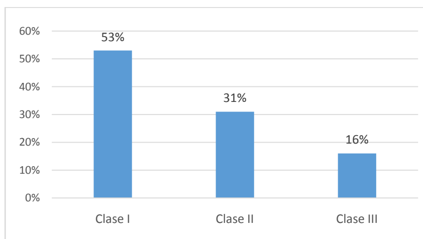
Figura 2. Frecuencia de maloclusión según la clasificación del Angle. N= 1047.

Entre las maloclusiones en sentido sagital la más frecuente fue la Clase I, que se presentó en un 53% (Ver Figura 2).