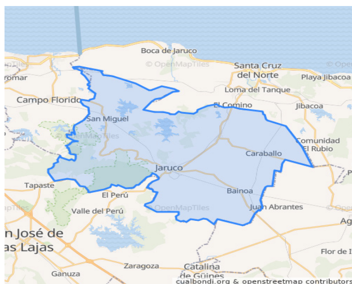
Figura 1. Mapa del municipio Jaruco, provincia Mayabeque, Cuba.

Se escogieron tres fincas en transición agroecológica de cinco años, las cuales tienen similitudes en cuanto a que presentan una topografía llana, el tipo de suelo que predomina es Pardo Sialítico con carbonatos, y son consideradas de buena productividad (Yong, Crespo,