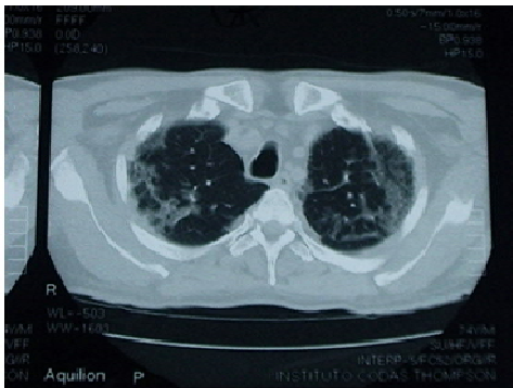
Fig. 3. Infiltrado Intersticial en Vidrio Esmerilado

Caso 4: Mujer de 59 años, que consulta por cuadro de 20 días de evolución por lesiones eritemato-violáceas a nivel del cuello, escote, miembros superiores y de las manos, mialgias, artralgias, sensación febril y aparición de aftas dolorosas a nivel de mucosa bucal y lengua, a su ingreso se constata disnea en reposo, que se intensifica con el correr de los días. Examen físico: A nivel de piel: Eritema en heliotropo (figura 4), signo de Gottron (figura 5), manos de mecánico (figura 5), signo del Chal. Debilidad muscular proximal de los cuatro miembros 2/5. Lesión ulcerosa en lengua y mucosas. Laboratorio: Creatinfosfoquinasa: 3796 UI/l, Aldolasa: 36, ANA: Negativo. Anti DNA: Negativo. Anti Jo y HIV: negativos. Gasometría arterial: alcalosis respiratoria con hipoxemia. Radiografía de tórax: Infiltrado intersticial bilateral. Tomografía Computada de Alta Resolución de Tórax Simple: Infiltrado intersticial en panel de abejas (figura 6). Ecocardiografía: Presión Sistólica Pulmonar: 38mmHg. Recibe 3 pulsos de metilprednisolona 1g/día y 1 bolo de ciclofosfamida 1g/m 2 de superficie corporal, pero el cuadro no mejora y la paciente se complica con una neumonía intrahospitalaria, evoluciona a insuficiencia respiratoria aguda y fallece en la unidad de cuidados intensivos.