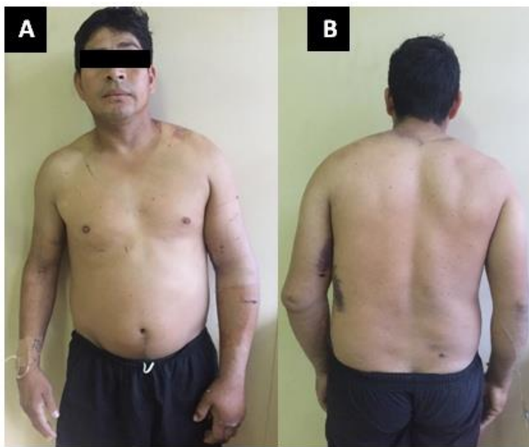
Figura 1. Paciente posterior a la revascularización de urgencia. A. Vista de frente. B. Vista posterior.

Paciente de sexo masculino, de 40 años edad, ingresa con antecedente de accidente en motocicleta y traumatismo de hombro izquierdo, quedando con dolor en región escapular derecha y signos de isquemia en la extremidad superior (parestesia, palidez, dolor, ausencia de pulsos y parálisis) (Figura 1). La arteriografía de urgencia confirmó la lesión: embolia de la arteria axilar izquierda (Figura 2). El diagnóstico fue de isquemia aguda postraumática de la extremidad superior izquierda por lesión de la arteria axilar (Grado 2B), junto a fractura del cuerpo de la escápula izquierda.