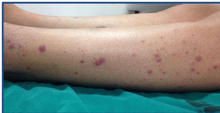
Figura 1. Clínica. Pápulas y placas eritematovioláceas de bordes regulares y límites netos en pierna de paciente con GPA.

La afectación cutánea se puede presentar en los distintos síndromes vasculíticos. Los hallazgos clínicos de las vasculitis son variados e incluyen máculas, pápulas, púrpura, lívedo, petequias, úlcera, nódulos y necrosis (1-3) ( Figura 1 , Figura 2 y Figura 3 ). El tamaño del vaso afecto se correlaciona con la clínica. Las úlceras, nódulos, cicatrices, lívedo reticularis y necrosis se asocian con la afectación de los vasos arteriales-musculares, y orientan hacia una vasculitis persistente y recurrente, y con presencia de enfermedad sistémica (6,8).