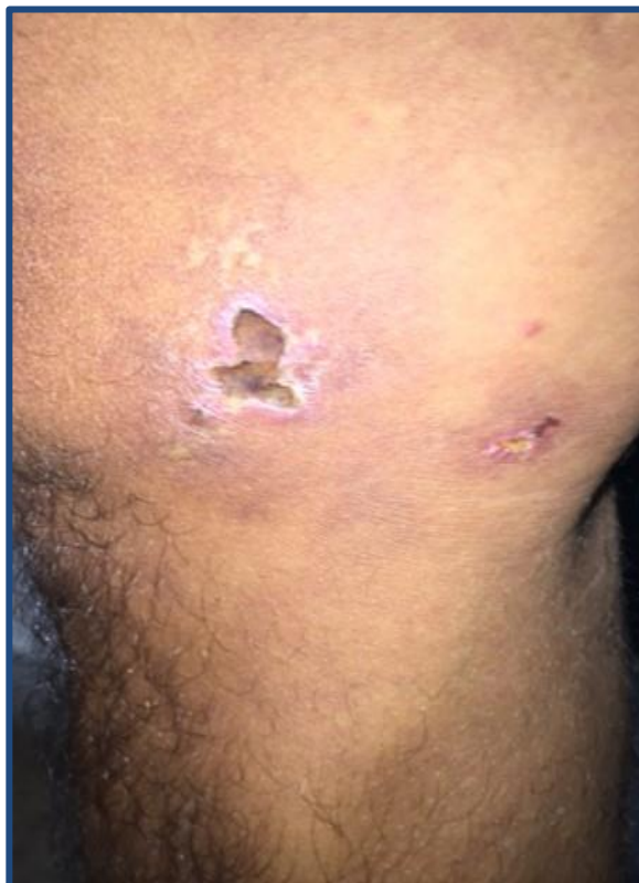
Figura 3. Clínica. Úlceras ovaladas y estrelladas, de entre 2 y 4cm, cubiertas de costras serohemáticas, rodeadas de halo eritematoso, bordes irregulares, límites netos, que asientan cara interna de la rodilla derecha. Paciente con PAM. Iconografía Cátedra de Dermatología FCM-UNA.