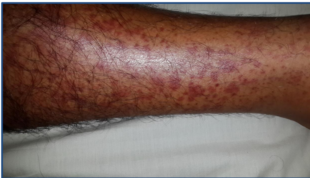
Figura 2. Clínica. Pápulas eritematovioláceas (púrpura palpable) y petequias en pierna de paciente con PSH. Iconografía Cátedra de Dermatología FCM-UNA.