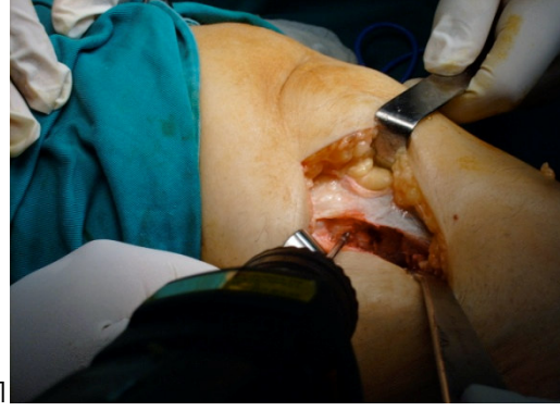
Figura 4. Exposición de la metáfisis tibial*