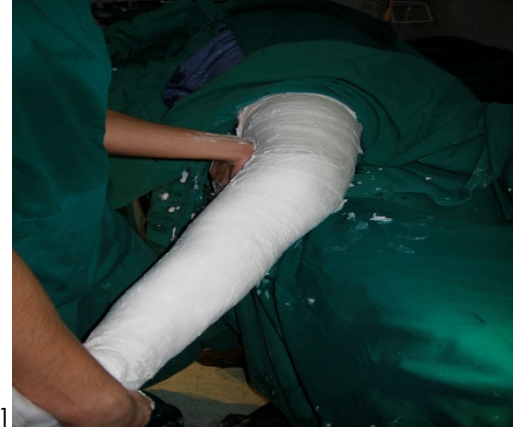
Figura 6. Maniobra de "force" en valgo de rodilla y enyesado*