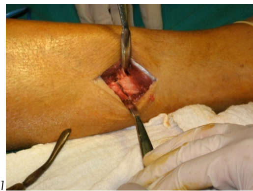
Figura 1. Manguito compresivo o lazo neumático* Figura 2. Previa osteotomía del peroné*