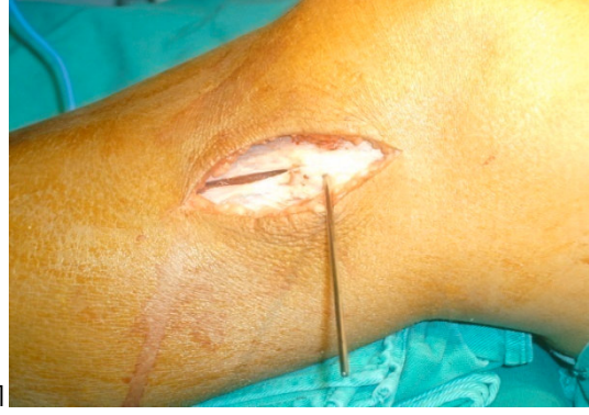
Figura 3. Abordaje y fasciotomía preventiva*