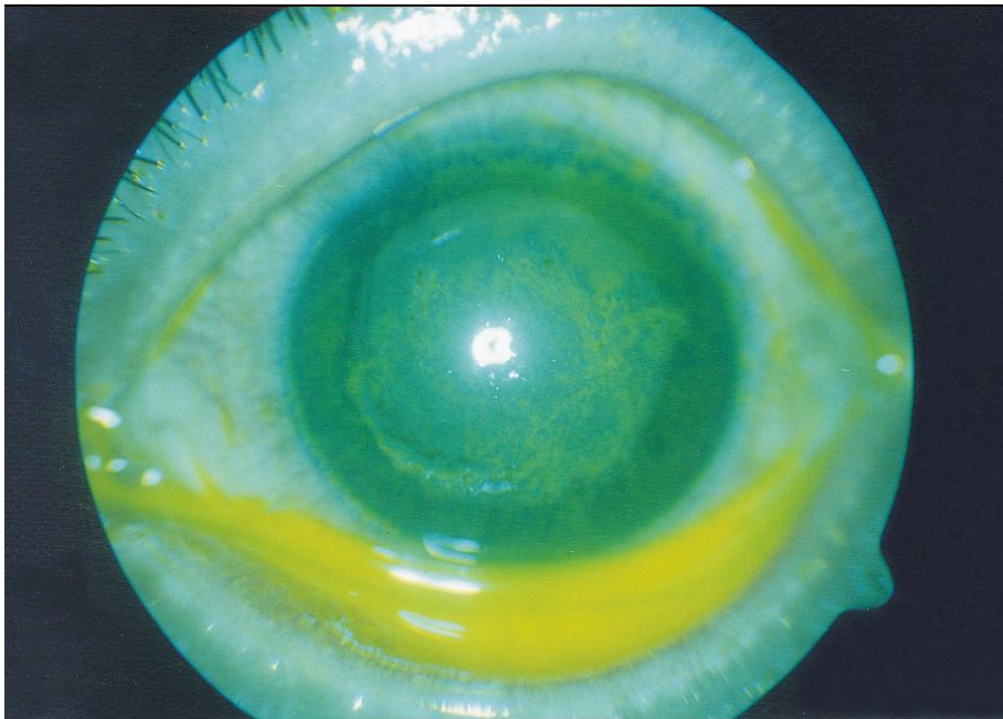
Figura 1 : Queratitis por Acanthamoeba . Tinción con fluoresceína (biomicroscopía)

La tinción con fluoresceína evidencia una queratopatía punteada superficial con tendencia a un patrón anular (Figura 1), mientras que la tinción con rosa de bengala es negativa.