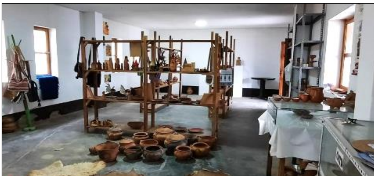
Figura 3. Objetos alfareros para la comercialización. Asociación La Cusana.

La figura 3 pone de manifiesto una característica predominante en la alfarería de Huancas, que se refiere a la confección de objetos diseñados principalmente con fines utilitarios. Mayoritariamente, estos objetos se destinan a la cocción de alimentos, presentando en algunos casos patrones ornamentales en forma de Zig Zags y soguillas, manifestando así la influencia del patrón cultural prehispánico de Chachapoyas.