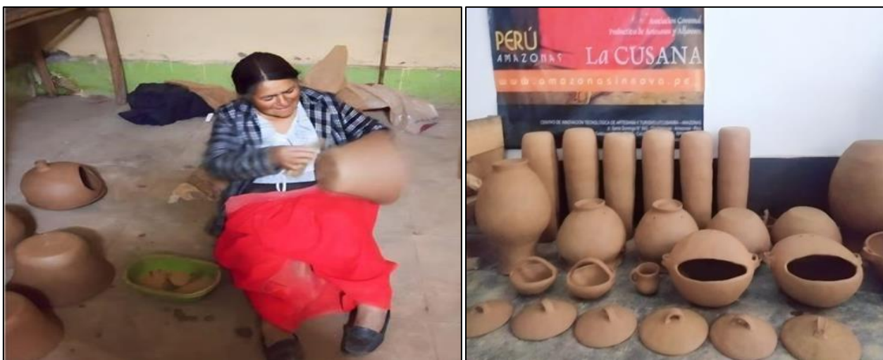
Figura 2. Mujer Huanquina realizando el proceso de elaboración de vasijas.